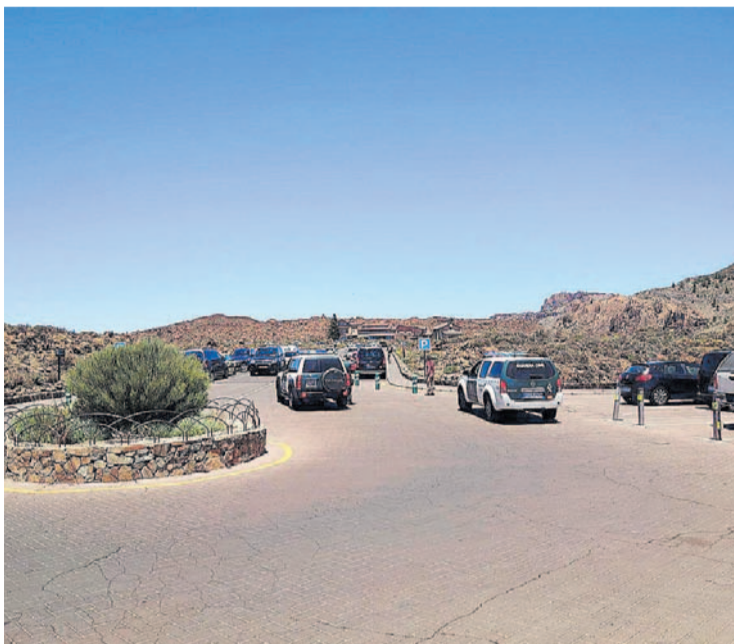
Parque Nacional del Teide.

Las últimas semanas, el aforo en los aparcamientos del parque ha estado limitado al 20% y García señala que se mantendrá así hasta que el Gobierno de Canarias fije unos criterios homogéneos para todos los parques del Archipiélago, tal y como establece la normativa para la fase 3 de la desescalada, en la que Tenerife entró ayer. "Hasta que no haya otro criterio