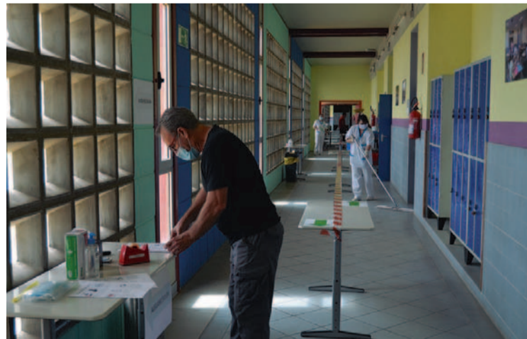
LIMPIEZA DEL PASILLO

El Abitur de este centro, reconocido oficialmente como Colegio Alemán de excelencia en el extranjero, se celebra bajo el cumplimiento estricto de un protocolo de higiene y el respeto a los dos metros de distancia mínima entre personas. La entrada a las instalaciones se realiza con mascarilla y, después de un lavado de manos en la entrada, los alumnos pasan a las salas de examen, que se ven-