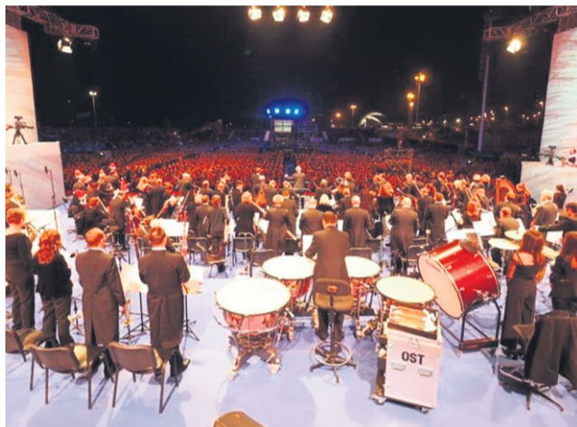
Das Weihnachtskonzert der Sinfoniker von Teneriffa hat eine lange Tradition. 2020 wird in 26 Jahren das erste Jahr sein, in dem es nicht stattfinden kann.

Von der Hafenbehörde Teneriffa, die alljährlich Veranstalter des Traditionskonzerts des