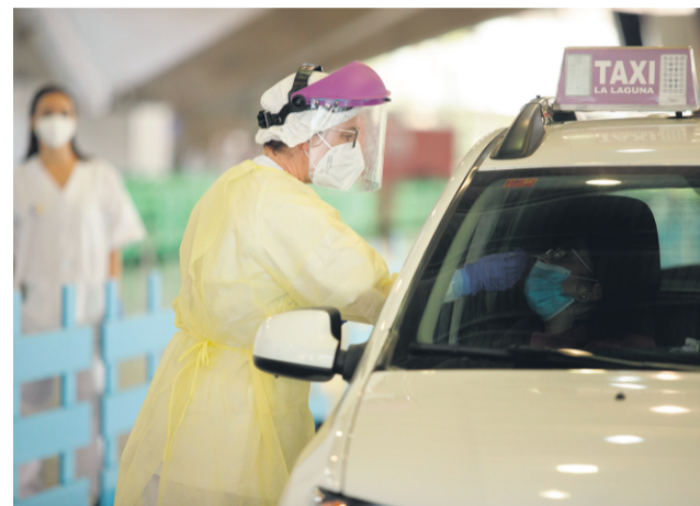
In Santa Cruz wurde das Testzentrum in der Messehalle eingerichtet.

Für die Teilnahme an dem Corona-Screening werden symptomfreie Personen im Alter zwischen 20 und 65 Jahren gesucht, die weder wegen engen Kontakts zu einem Infizierten in Quarantäne sind, noch aktuell oder in den zurückliegenden drei Monaten an Covid-19 erkrankt sind. Personen aus den genannten Stadtgebieten, die an