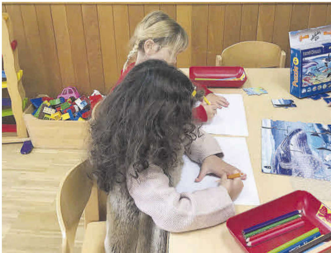
Alumnos trabajando juntos

En el Colegio Alemán Santa Cruz de Tenerife los niños asumen un papel activo en su aprendizaje, mientras que los educadores los acompañan ofreciendo estructuras regladas